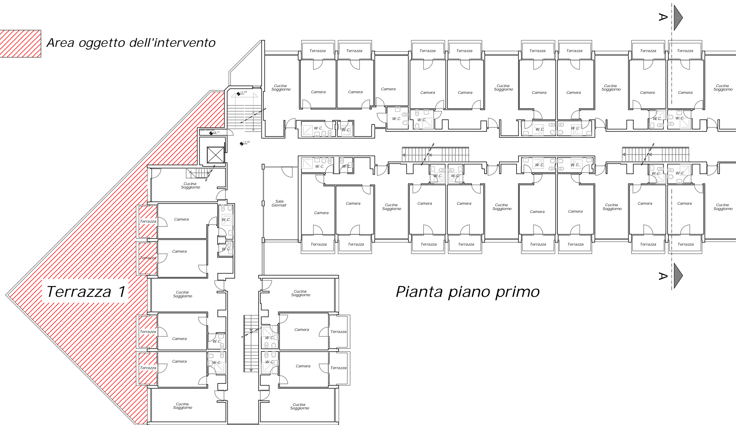
Pianta piano primo