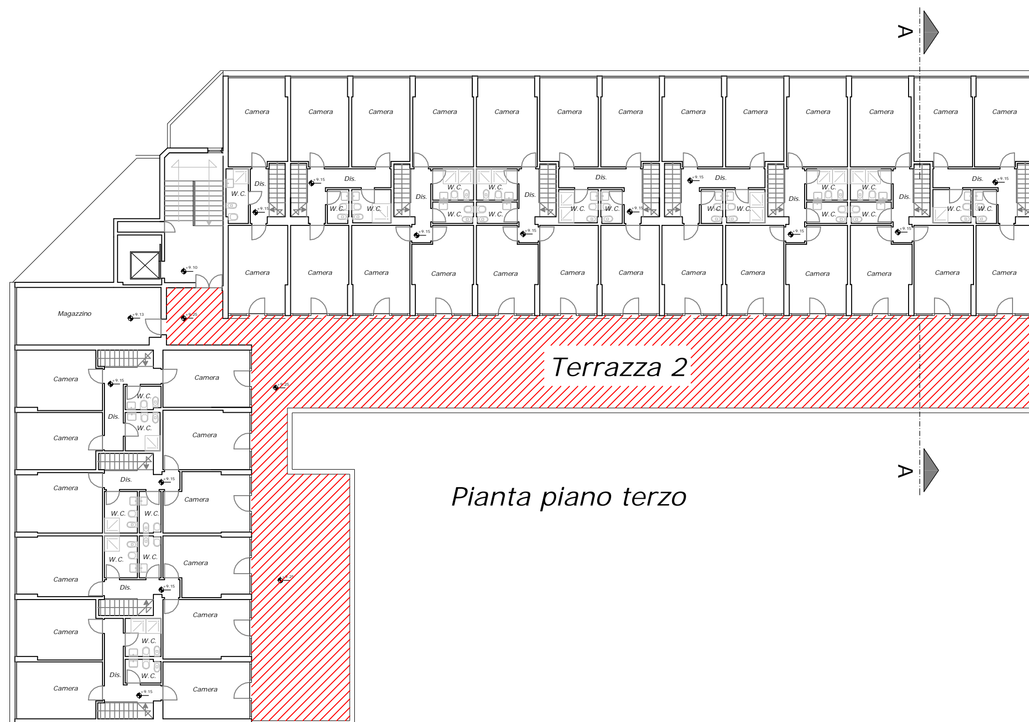
Pianta piano terzo